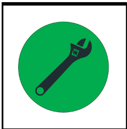
Konec zóny bez cizí pomoci