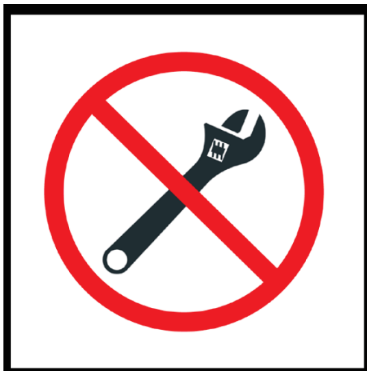
Začátek zóny bez cizí pomoci