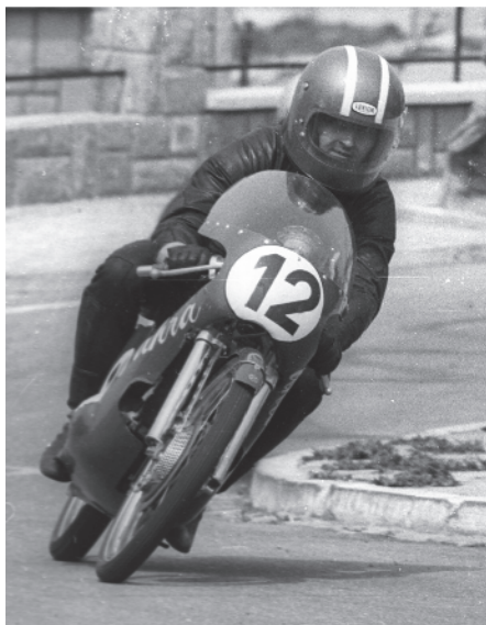
S padesátkou ahrou na okruhu v Hlučíně v roce 1974