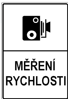
IP 31a Měření rychlosti

18. V příloze č. 3 bodu 5 písmeni a) se doplňují vyobrazení a názvy značek „IP 31a Měření rychlosti“ a „IP 31b Konec měření rychlosti“.