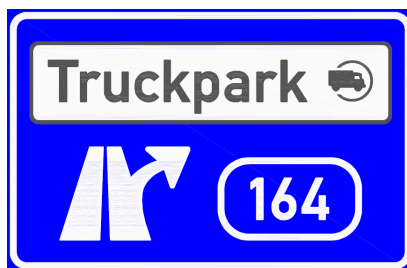
IJ 17a Truckpark