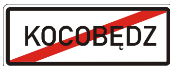
IS 12d Konec obce v jazyce národnostní menšiny

20. V příloze č. 3 bodu 5 písmeni c) se doplňuje vyobrazení a název značek „IJ 16 Silniční kaple“, „IJ 17a Truckpark“ a „IJ 17b Truckpark“.