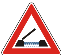
A 33 Pohyblivý most

17. V příloze č. 3 bodu 1 se doplňuje vyobrazení a název značky „A 33 Pohyblivý most“.