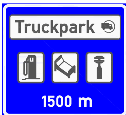
IJ 17b Truckpark

21. V příloze č. 3 bodu 6 se doplňuje vyobrazení a název značky „E 12 Jízda cyklistů v protisměru“.