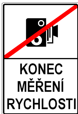
IP 31b Konec měření rychlosti

19. V příloze č. 3 bodu 5 písmeni b) se mění vyobrazení značek „IS 12c Obec v jazyce národnostní menšiny“ a „IS 12d Konec obce v jazyce národnostní menšiny“.