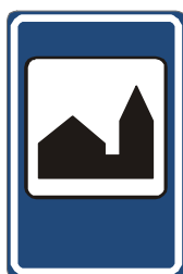
IJ 16 Silniční kaple

20. V příloze č. 3 bodu 5 písmeni c) se doplňuje vyobrazení a název značek „IJ 16 Silniční kaple“, „IJ 17a Truckpark“ a „IJ 17b Truckpark“.