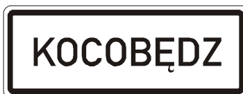
IS 12c Obec v jazyce národnostní menšiny

19. V příloze č. 3 bodu 5 písmeni b) se mění vyobrazení značek „IS 12c Obec v jazyce národnostní menšiny“ a „IS 12d Konec obce v jazyce národnostní menšiny“.