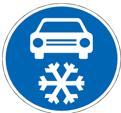
C 15a Zimní výbava

„C 15a Zimní výbava“ a „C 15b Zimní výbava – konec“.