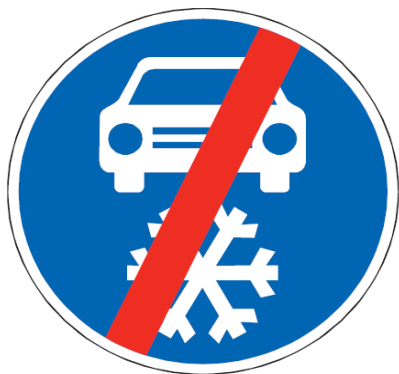
C 15b Zimní výbava – konec